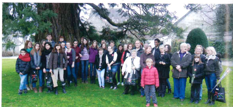
Empfang in Brie-Comte-Robert