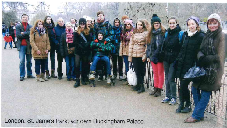
London, St. Jame's Park, vor dem Buckingham Palace