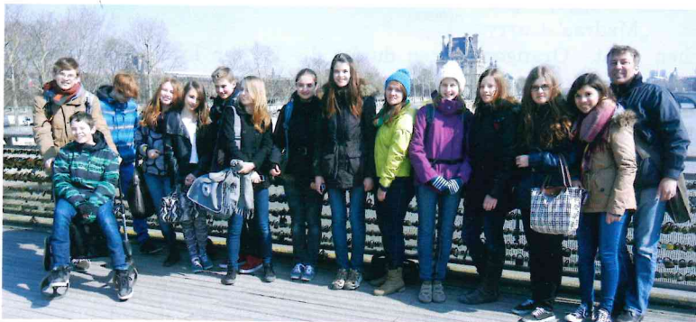
Paris, vor dem Louvre