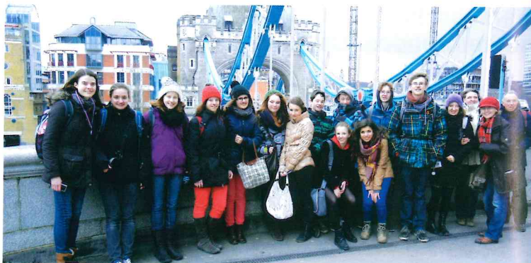
London, auf der Tower Bridge